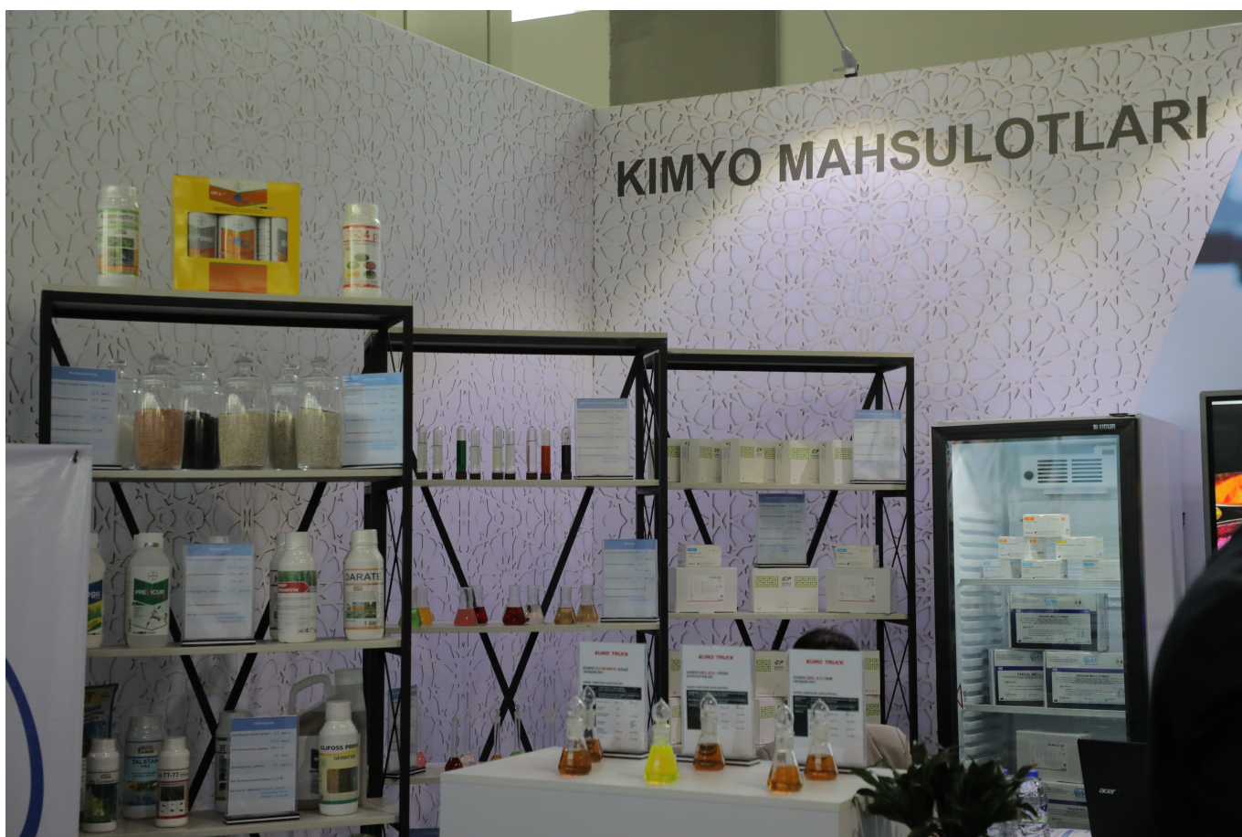
“O‘zkimyosanoat” AJ Matbuot xizmati