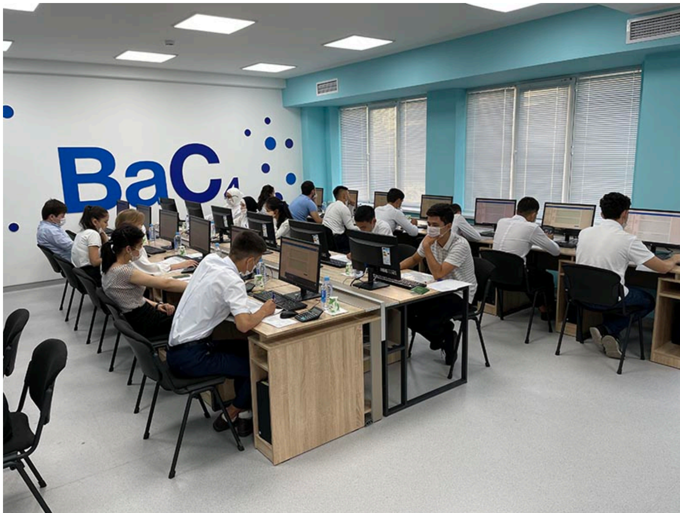
“O'zkimyosanoat” AJ Matbuot xizmati