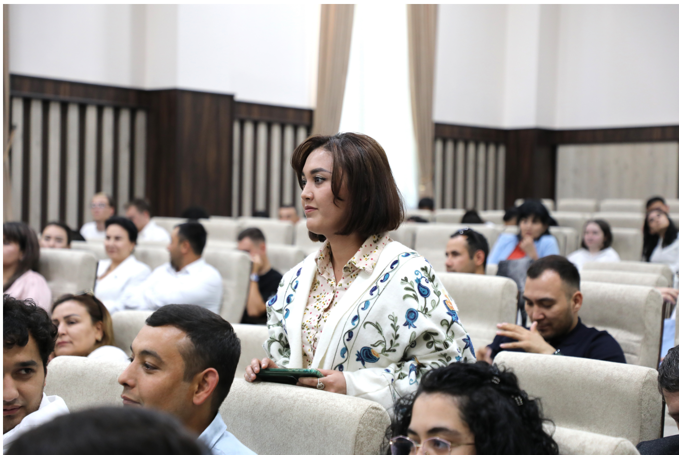
Bu kabi muloqotlar yoshlarning huquqiy savodxonligini oshirishga xizmat qilishi qayd etildi.