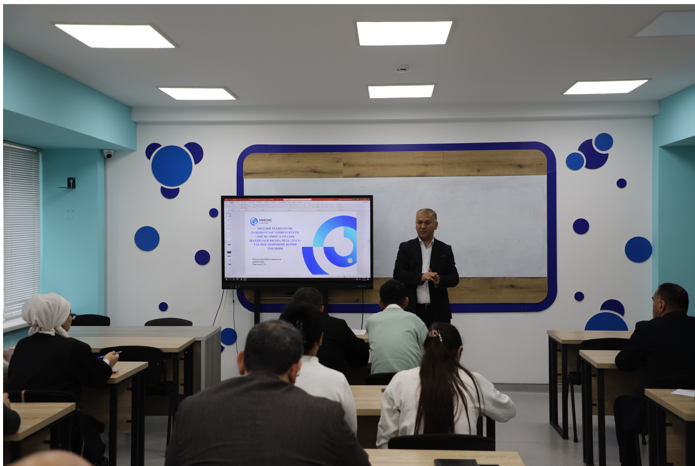
Ishtirokchilarga tashkilotchilar tomonidan sertifikatlar topshirildi